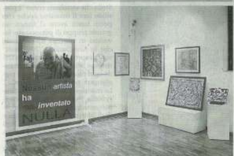
Alcune delle opere esposte

● Sino a fine mese presso la galleria d'arte contemporanea "Santo Vassallo" dell'ex Collegio dei Gesuiti a Mazara del Vallo, si potrà visitare la mostra "A volte mi dimentico di essere vivo", dedicata a Salvo Catania, pittore autodidatta scomparso qualche mese addietro. La mostra è allestita col patrocinio del Comune. E' possibile visionare le oltre 500 opere che il maestro Catania ha realizzato negli anni. Altre opere dell'artista si possono ammirare nelle mattonelle che decorano Villa Jolanda, sulle panchine di corso Umberto, nei quadri esposti al palazzo comunale e in tanti pub e locali del centro storico. (*MAX)